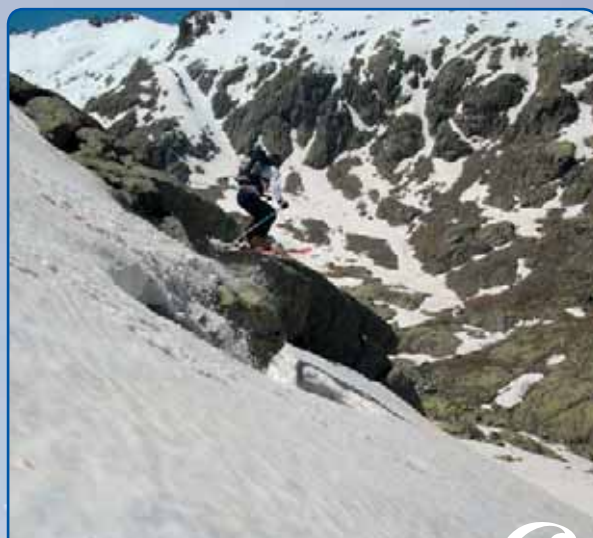
Rider: JFH. Gredos 18/05/2010

* En todos los casos se deberá pagar el 100% de una sola vez.