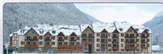
RESIDENCIA PRESTIGE BELVEDÈRE