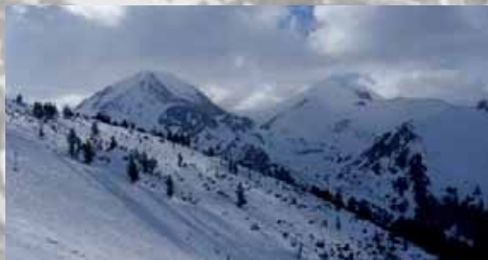
Pista Copa del Mundo. Alberto Tomba