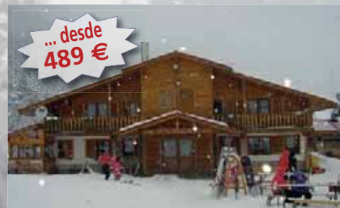
Estación de esquí Bansko