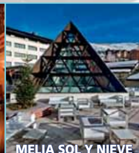
MELIA SIERRA NEVADA