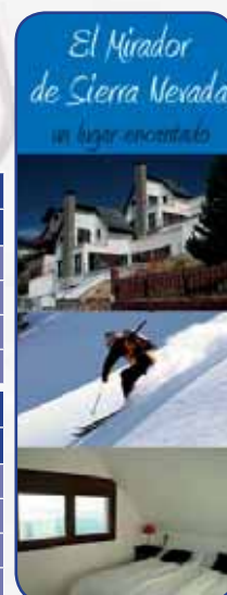
El Mirador de Sierra Nevada un lugar encantado